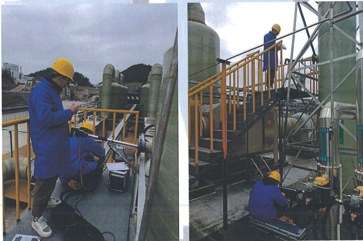
图7-2 部分现场采样图片